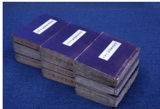
国指定重要文化財 「鉄道古文書」