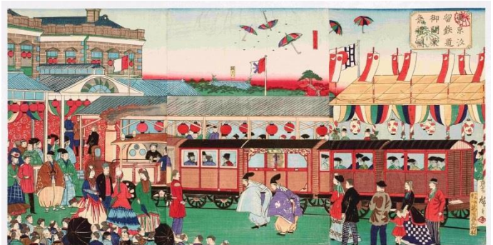
「東京汐留鉄道御開業祭礼図」